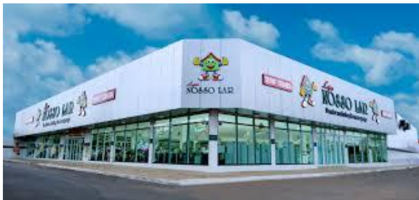
(Fachada da empresa “Nosso Lar” Porto Nacional).

A loja nosso lar porto nacional está situada a Avenida Joaquim Aires como visto no mapa.