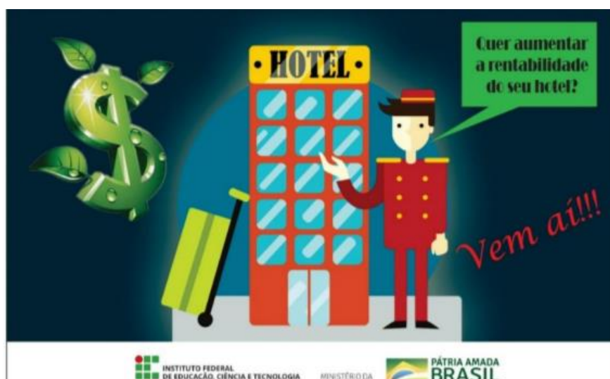
Figura 2: Convite palestra.

duração de 4 horas no total, podendo o gestor do hotel escolher o dia e hora que melhor se adequasse a sua realidade. Vale destacar que em todos os dias era disponibilizado em turnos distintos para que pudesse atender a todos os públicos distintos. Foi criada uma arte para a primeira chamada do evento, tendo como objetivo despertar o interesse e curiosidade de que seria oferecido (Figura 2).