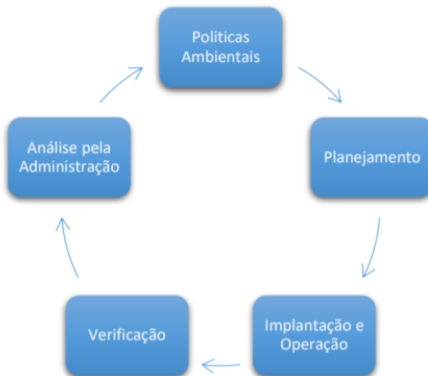
Figura 1: Fluxograma da metodologia PDCA.