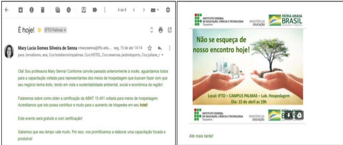
Figura 4: Lembrete final convite palestra.