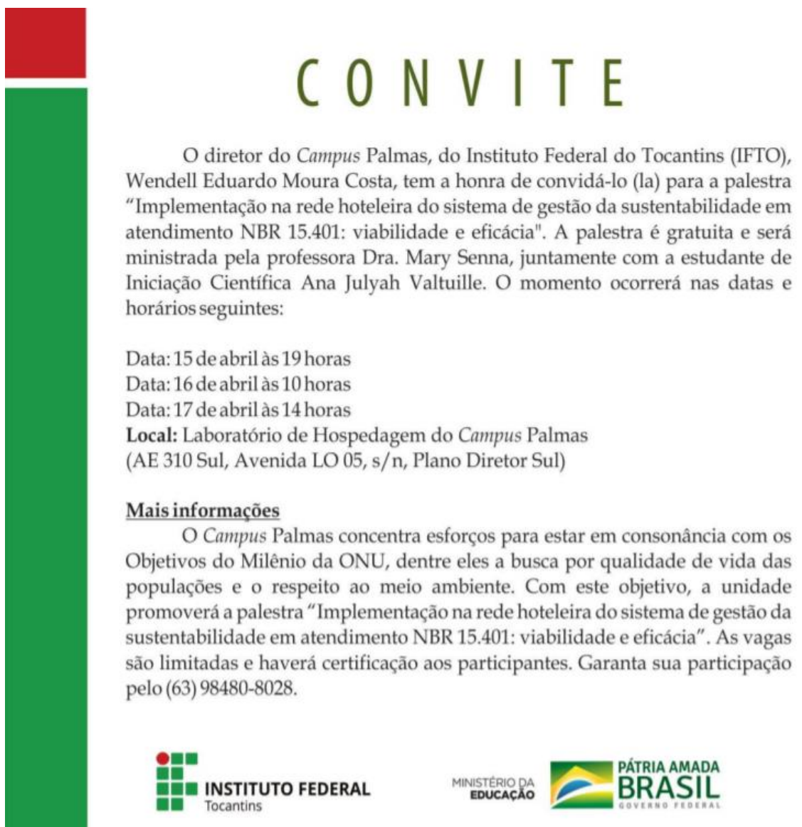
Figura 3: Carta convite aos hotéis.

apesar de não ser considerado satisfatório para o total de hotéis encontrados em Palmas, optou-se em manter o evento por considerar que atingir-se-ia o público interessado, podendo após isso realizar capacitações in loco.