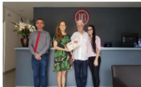
Figura 8: Capacitação Hotel 2.