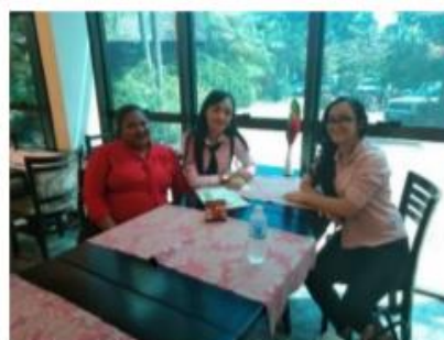
Figura 10: Capacitação Hotel 2.