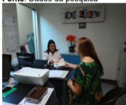
Figura 11: Capacitação Hotel 1.