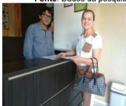
Figura 12: Capacitação Hotel 2.

Durante a capacitação foi perguntado sobre a existência dos sistemas sustentáveis dos hotéis, bem como, foi realizada a observação das instalações dos mesmos, ainda que fosse o objetivo de estudo deste trabalho.