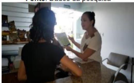
Figura 9: Capacitação Hotel 1.