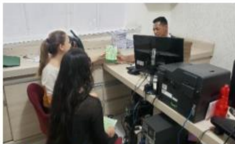
Figura 7: Capacitação Hotel 1. Fonte: Dados da pesquisa

simultaneamente. Em todos houve boa receptividade, mas em alguns hotéis (10%) não foi possível realizar a capacitação diretamente com estes profissionais, sendo realizada capacitação com o funcionário da recepção e estando este comprometido em repassar as informações para os gestores Figuras 7 a 12).