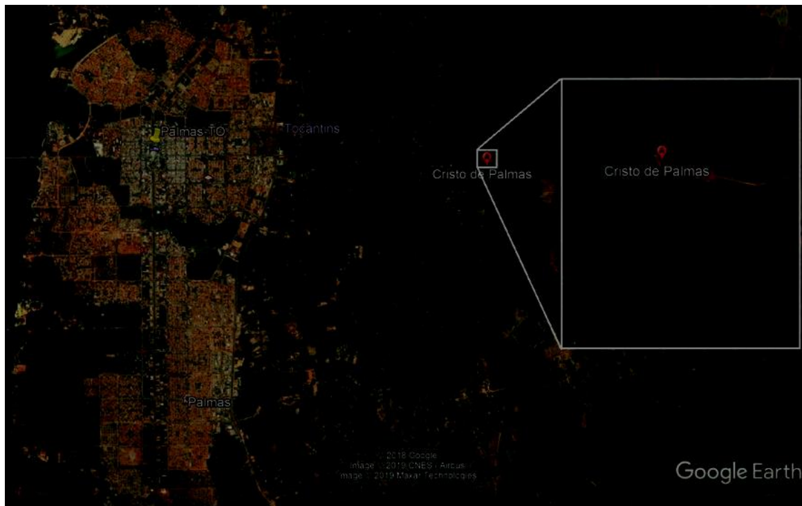
Figura 01. Mapa de localização do Morro do Chapéu, Cristo Redentor. Coordenadas geográficas de 10°11'52" S e 48°14'55" O, altitude de 633m.

Atualmente existe um projeto em andamento para criação do Monumento Cristo Redentor, no Morro do Chapéu. A infraestrutura no local até momento, consiste na construção da base para montagem do monumento. O corpo do Cristo se encontra no Ceará, já modelado em fibra pela empresa Construtora Wetter.