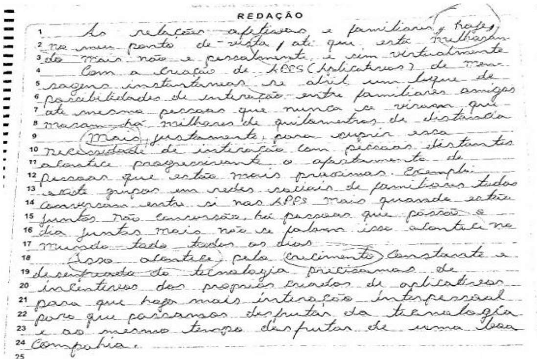
Figura 6 R5

Faremos uma análise de dados com base nas exigências do vestibular, considerando o ponto de vista e a didática utilizada pelos professores assim como também algumas das redações avaliadas durante a pesquisa. Vale ressaltar que corrigimos os, analisamos a constituição deles com base na sequência didática.