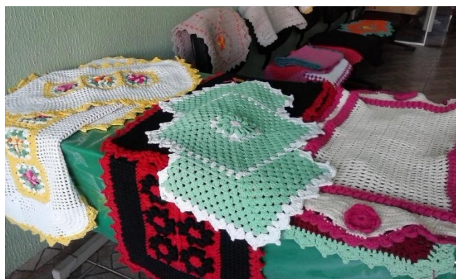
Figura 2 - Projeto “Tecendo um Novo Futuro”