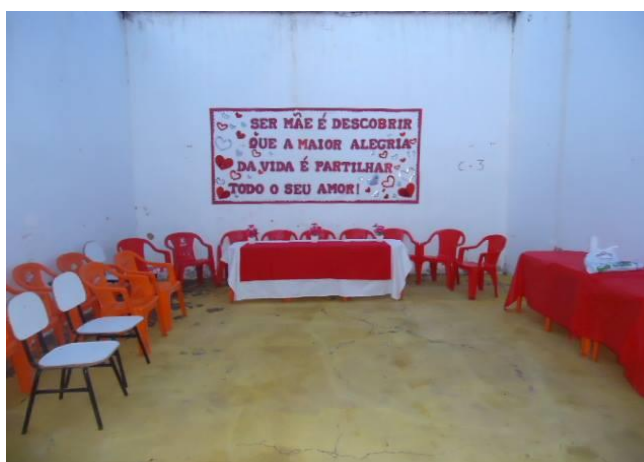
Figura 8 - Projeto “Dia das Mães”

Esse projeto em comemoração ao dia das mães é uma ação que faz parte do calendário anual da UPF de Pedro Afonso. Sendo também uma ação da “Escola EJA Prisional”, que visa promover a participação da comunidade em geral nos processos de ressocialização e reeducação, tendo como objetivos específicos: reeducar as mulheres privadas de liberdade, auxiliando a elevação da autoconfiança, a fim de que tenham fé em dias melhores, lembrar que elas estão presas, mas não deixaram de ser mães; colaborar para o fortalecimento afetivo entre as reeducandas, e delas com os servidores e a comunidade; através de uma aula diversificada, centrada em ações dinâmicas como: teatro, dança, música, poesia, vídeos, poemas, artesanato, contos, depoimentos, entre outras.