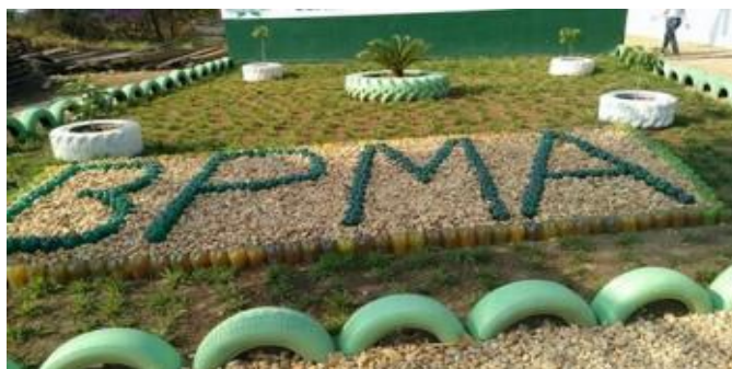
Figura 1 - Praça ecológica construída por reeducandas da UPF de Pedro Afonso

A ação premiada pela Innovare , em 2015, foi a realização do projeto “Ressocialização Sócio Ambiental”, no qual as reeducandas recolhidas na Unidade Prisional Feminina de Pedro Afonso ajudaram com a mão-de-obra na construção de praças ecológicas na cidade. Neste sentido, a figura 2 mostra uma das praças ecológicas construídas pelas reeducandas de Pedro Afonso.