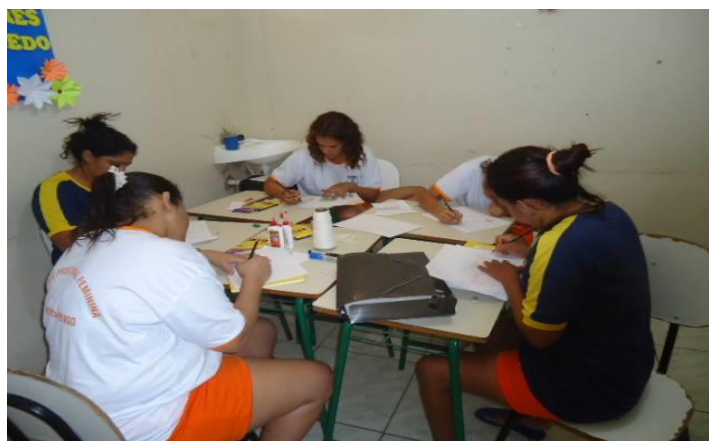
Figura 4 - Projeto “Escola EJA Prisional”

A “Escola Prisional” conta com um quadro de servidores, que dispõe de 4 (quatro) professoras, que ministram conteúdos programáticos e ações diversificadas, que almejam favorecer as detentas no processo de ressocialização e reeducação.