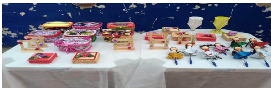
Figura 13 - Objetos produzidos pelo Projeto Primavera

O projeto trouxe muitos benefícios na vida das reeducandas que aprenderam a fazer arte do lixo e com isso ganhar dinheiro com as vendas dos objetos confeccionados. Além disso observou-se a diminuição de lixo descartados da carceragem e a reutilização de diversos materiais no dia-a-dia.