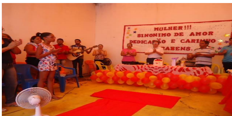
Figura 5 - Projeto “A Importância da Mulher: Dentro e Fora do Sistema Prisional”

Esse projeto teve como objetivos específicos promover a participação da comunidade em geral no Projeto; favorecer os processos de ressocialização e de reeducação das reeducandas; favorecer a elevação da autoconfiança e da fé em dias melhores das reintegrandas da UPF de Pedro Afonso/TO; sensibilizar as reeducandas, mostrando que elas são importantes, mesmo estando privadas de liberdade; favorecer o desenvolvimento do senso crítico, através de palestras; favorecer a elevação da autoestima das reeducandas, através de desfile e favorecer o fortalecimento afetivo das reeducandas com familiares.