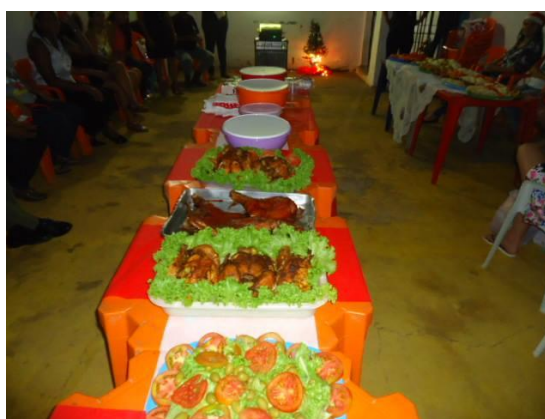
Figura 10 - Projeto “Fim de Ano sem Liberdade mas com Dignidade”

Observa-se que o Poder Judiciário, Promotoria e Defensoria Pública de Pedro Afonso são parceiros da equipe da Unidade Prisional de Pedro Afonso e caminham rumo a consolidar os processos de ressocialização e de reeducação.