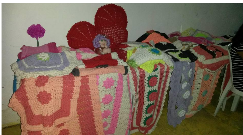
Figura 3 - Projeto “Tecendo um Novo Futuro”

O projeto é realizado em vários locais da cidade de Pedro Afonso, como galerias, feiras, fórum, promotoria, defensoria e eventos. Sempre que a Unidade Prisional Feminina é convidada a participar dos eventos municipais, três reeducandas tem a oportunidade de sair da carceragem e vender os produtos produzidos pelas demais detentas.