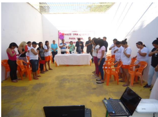
Figura 7 - Projeto “Mais uma Chance para a Vida”

Essa ação de conscientização e de prevenção teve como justificativa o diagnóstico da situação de risco, que mostra um percentual elevado de mulheres envolvidas com o tráfico e o uso de drogas lícitas e ilícitas.