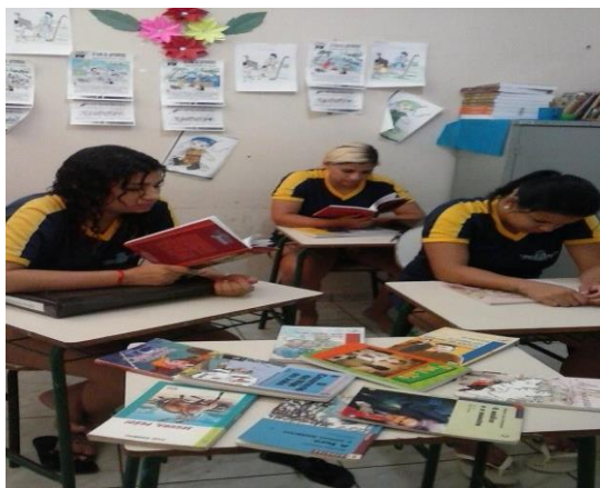
Figura 6 - Projeto “Remição pela Leitura”

A figura 7 retrata as reeducandas da Unidade Prisional Feminina de Pedro Afonso realizando leituras.