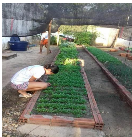
Figura 12 - Projeto "Horta e Jardinagem"

A figura 14 mostra alguns canteiros do projeto na Unidade Prisional Feminina de Pedro Afonso.