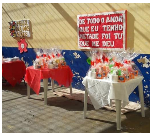
Figura 9 - Projeto “Dia das Mães”

De acordo com a metodologia do projeto (2016), o evento conta com a presença do grupo de oração Nossa Senhora e membros da Igreja Adventista do Sétimo Dia, fazem reflexões sobre os problemas enfrentados no dia a dia, como a violência, a criminalidade e a superação, entremeadas com cânticos de louvor a Deus, buscando despertar nas reeducandas o desejo de serem pessoas melhores.