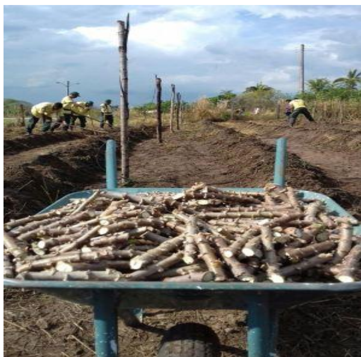
FIGURA 01 - Manivas de mandioca - projeto reniva

Segundo a Cooperativa Agroindustrial do Tocantins - COAPA (2017) o projeto RENIVA aprimora cerca de 69 famílias que atuam na agricultura familiar com manivas de mandioca livre de doenças e pragas. O plantação é realizada conforme figura abaixo: