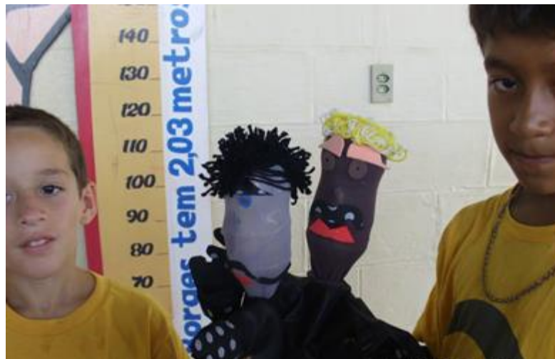
Imagem 9 – Momento que os bonecos recicláveis do projeto ReciclARTE são finalizados. Dupla de alunos que trabalharam colaborativamente. Acervo pessoal. 2014.

O último e quarto encontro foi a reunião de todos os alunos na sala de jogos que a fundação dispõe, onde terminamos de fazer os últimos ajustes nos bonecos e, em seguida cada aluno começou a usar seus próprios bonecos na roda de conversa que se instalou.