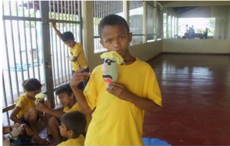
Imagem 6 – Momento de confecção dos bonecos recicláveis no projeto ReciclARTE. 2014.

O projeto se iniciou no dia 11 de setembro de 2014, quando fui a escola Canuaña para me apresentar e propor o projeto ao diretor e o coordenador, explicando que o mesmo tinha era um projeto para a futura escrita monográfica cujo o objetivo era o de proporcionar uma experiência de feitura e manipulação com bonecos as crianças do 4º e 5º ano e perceber como as mesmas se comportavam diante desse processo.