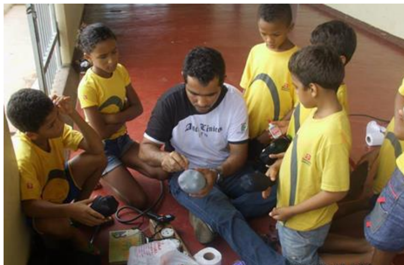
Imagem 8 – Momento que os alunos estavam observando como se deve confeccionar o boneco durante a feitura do meu. 2014.

No final de semana seguinte, dia 07 de novembro, começamos enfim a construir os bonecos, eu mesmo levei os materiais, principalmente as garrafas pet, pois tudo o que é consumido dentro da fundação, é produzido por eles mesmos, desde carne até o leite. Por isso, logo na entrada os locais onde os alunos aprendem os diversos ofícios que a mesma disponibiliza, como marcenaria, agricultura, entre outros.