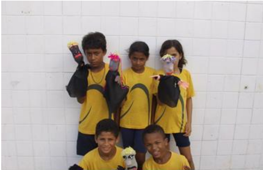
Imagem 5 – Última etapa do projeto ReciclARTE, os alunos participantes com seus bonecos recicláveis confeccionados por eles mesmos. 2014.

criação artística, de trabalho em conjunto, de educação e de prazer.” (MACHADO, 2009, p. 56), e isso é evidente visto que, a atenção terá que ser redobrada para o desenvolvimento de uma obra produtiva.