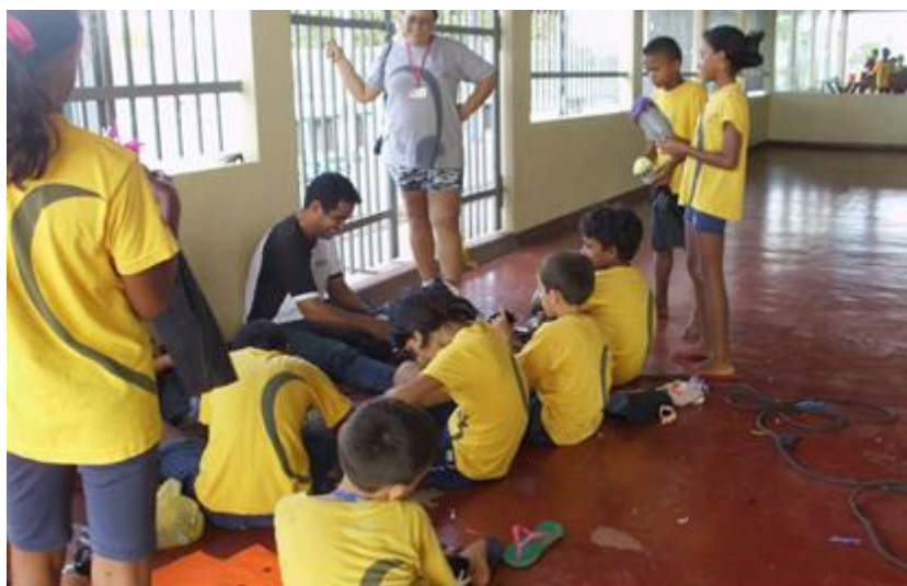
Imagem 7 – Momento de confecção dos bonecos recicláveis no projeto ReciclARTE sendo supervisionado pela professora de Educação Física. 2014.

Devido a rotina de estudos que a fundação Bradesco tem, rotina essa que é seguida de forma rígida, o projeto ReciclARTE ficou para ser realizado nos sábados na parte da tarde com os alunos, sendo sempre supervisionado por uma das professoras de educação física que trabalhavam excepcionalmente nos sábados e domingos com os alunos em jogos de entretenimento e lazer direcionados.