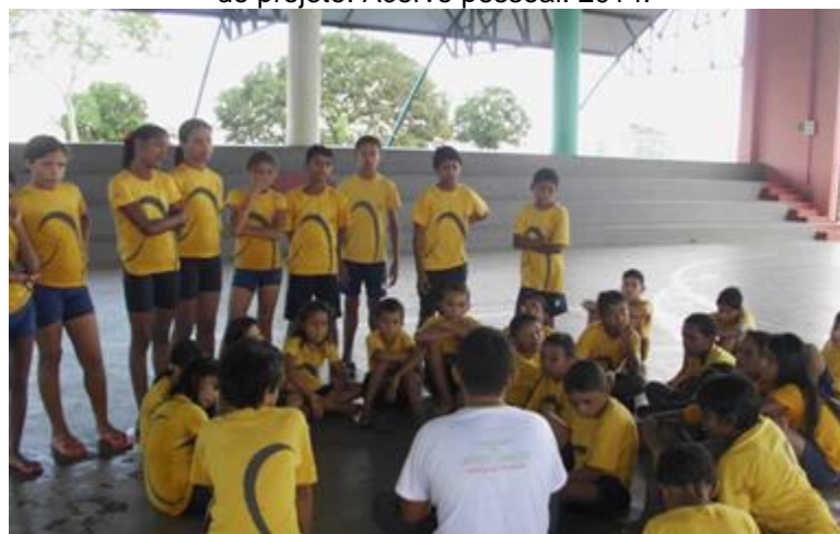
Imagem 3 – Início do projeto “ReciclARTE” na fundação Bradesco. Acolhida dos alunos e exposição do projeto. 2014.

Compreende-se, portanto, que o ensino de teatro não se restringe a somente a educação fundamental, mas todos os níveis de ensino, desde a educação infantil até o médio, pois de fato todos nós temos inerente a nós a capacidade expressiva independente de nossa idade, o que de fato importa e que ela seja explorada cada dia mais para ocorrer da mesma se estabilizar por falta de exercício, o que envolve pesquisa e prática constante da capacidade criativa do ser humano.