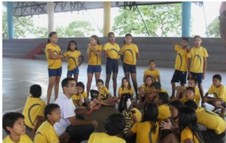
Imagem 2 – Início do projeto “ReciclARTE” na fundação Bradesco. Acolhida dos alunos e exposição do projeto. 2014.

Ora, entendemos por interdisciplinaridade o conceito que Yes Lenoir apud Ivani Fazenda (1998) aponta em seu livro “Didática e Interdisciplinaridade” que afirma que “a interdisciplinaridade trata dos saberes escolares, a integração é, antes de tudo, ligada a todas as finalidades da aprendizagem.” (FAZENDA, 1998, p. 53) Ou seja, tanto a inter quanto a transdisciplinaridade tentam a todo instante criar pontes de ação conceitual e prática entre os diversos campos do conhecimento. Entendido isso, é fácil perceber que o teatro, é por excelência uma disciplina que abrange de forma natural essas relações para a formação de experiências artísticas.