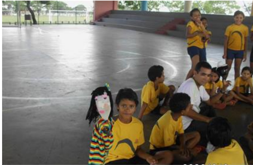
Imagem 4 – Acolhida dos alunos no projeto ReciclARTE, primeiros contatos dos alunos com o boneco reciclável. Acervo pessoal. 2014.

O teatro de bonecos por ser uma forma artística encantadora e fascinante, quando aliada a educação, transporta para a mesma todo o seu universo de animação estimulando os alunos a participar da história, pois o “teatrinho de bonecos é um canal por onde se escoia a imaginação, a capacidade de crer no irreal e de viver dentro dele tão própria do espírito infantil.” (MACHADO, 2009, p. 56) Independente de como é o boneco, se é feio ou bonito, com materiais nobres ou simples, o teatro de bonecos ultrapassa a barreira tátil para chegar ao universo da imaginação por meio da animação.