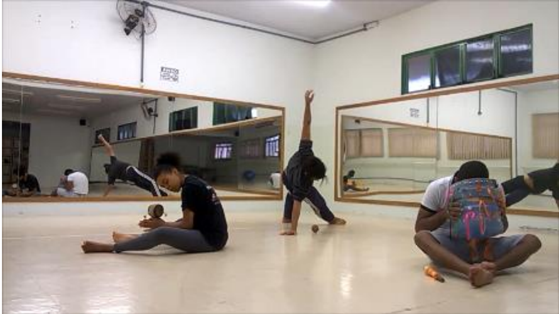
Figura 10 - Leitura do poema com sons variados