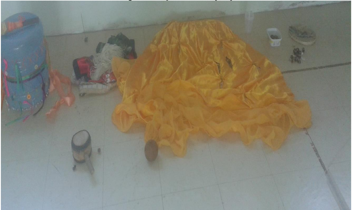
Figura 7 - Objetos utilizados para produzir sons