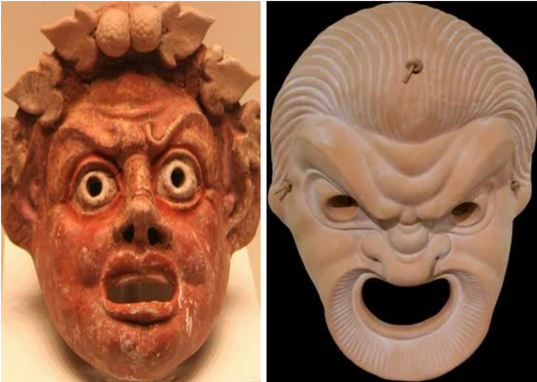
Figura 3: Mascaras usadas no teatro grego