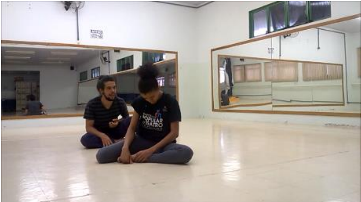
Figura 9 - Leitura do poema com os sons corporais