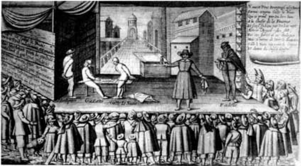
Figura 4: Ilustração do Teatro na Idade Média.