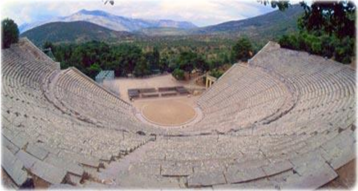
Figura 2 - Ruínas do Anfiteatro de Epidauro