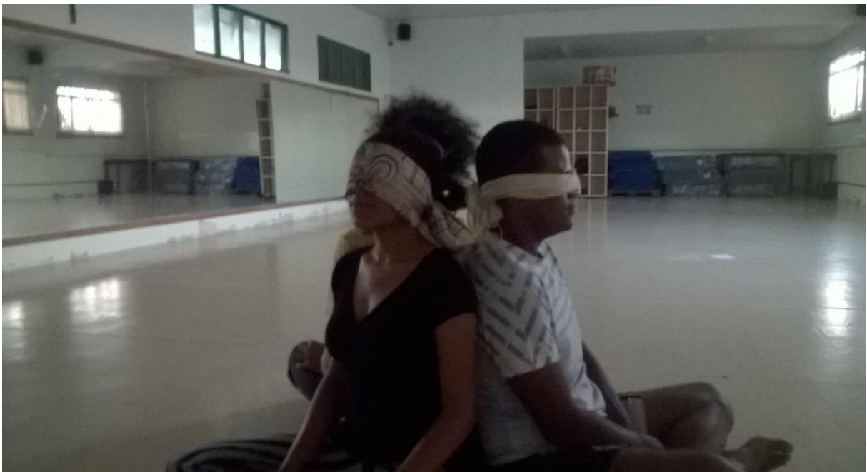
Figura 5- Exercício: Imaginando contextos para os ruídos que ouviam

O primeiro encontro (28/01/2016) teve como tema a Sensibilização para os sons que nos rodeiam , que contou com a participação de cinco pessoas com diferentes experiências na área teatral. A experimentação teve início com todos deitados com os olhos fechados, se concentrando na respiração e nos sons presentes dentro da sala e próximos a ela. Em seguida fizemos uma caminhada com os olhos fechados, aos poucos fui acrescentando diferentes ruídos, como chacoalhar um molho de chaves, som de moedas se chocando, copos descartáveis primeiro sendo pisados e rasgados e depois sendo amassados constantemente em diferentes intensidades.