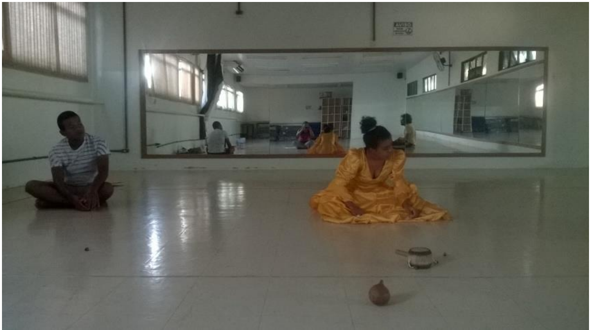
Figura 8 - Leitura do poema com uso de ruídos