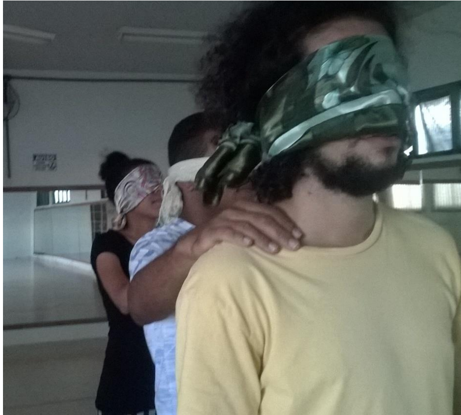
Figura 6 - Caminhada dos vendados com estímulos de ruídos.

Enquanto eram instigados a imaginar cenários em que aquelas folhas poderiam estarem sendo rasgadas, com diferentes objetivos e situações.