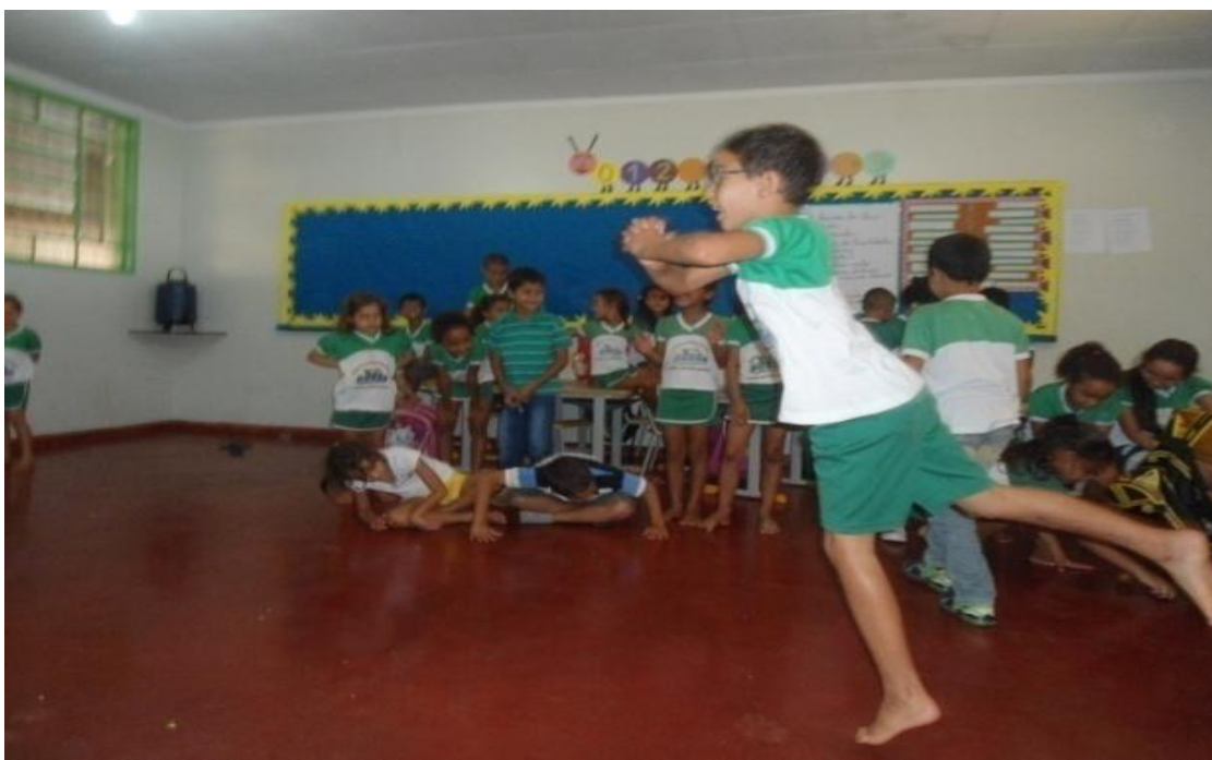
Figura 03 - Encenação Teatral

Assim criando através de suas expressões corporais e faciais uma encenação teatral. Este Jogo é individual cada estudante tem que criar uma cena e assim todos participam de forma espontânea.