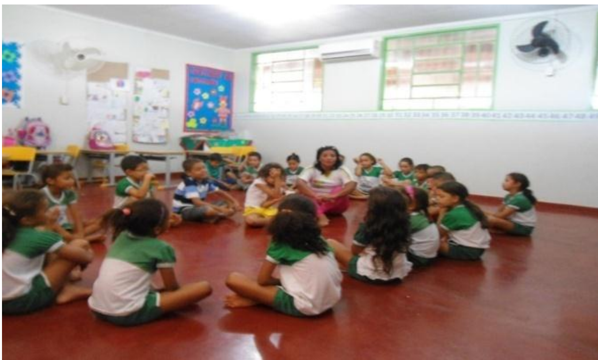
Figura 02 – O Jogo Teatral – sensações durante o Jogo

Em circunferências, como mostra a figura 02, relata como foram as sensações que conseguiram sentir durante o processo do Jogo.