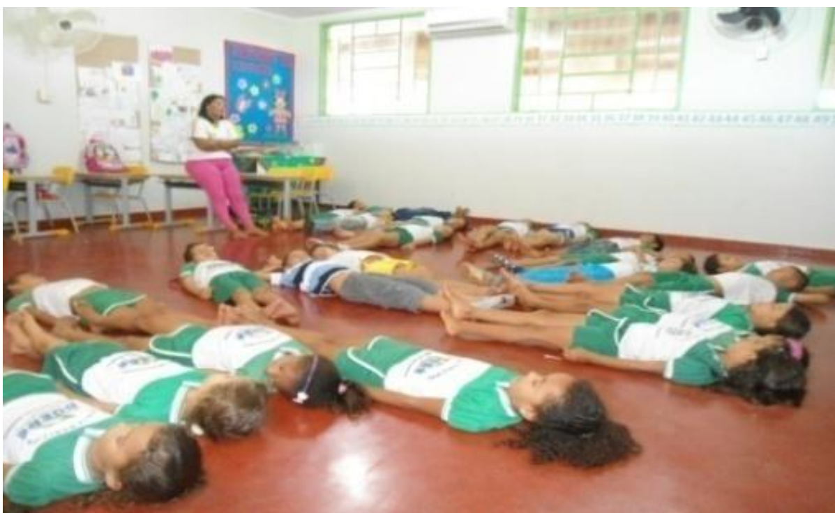
Figura 01- Prática de Jogos Teatrais

No primeiro momento do Jogo, a autora propôs que todos sentassem em circunferência, o mesmo sentou-se ao meio onde passou todos os comandos de como ocorreria o Jogo e informou que eles fariam uma grande viagem. Logo em seguida, convidou a todos se deitassem no chão com os olhos fechados, braços ao longo do corpo, inspirando e expirando lentamente, como indica a figura 01. Solicitou que eles acompanhassem somente com a imaginação, cada um em seu tempo. Se aprofundando como se eles estivessem vivenciando um momento real.