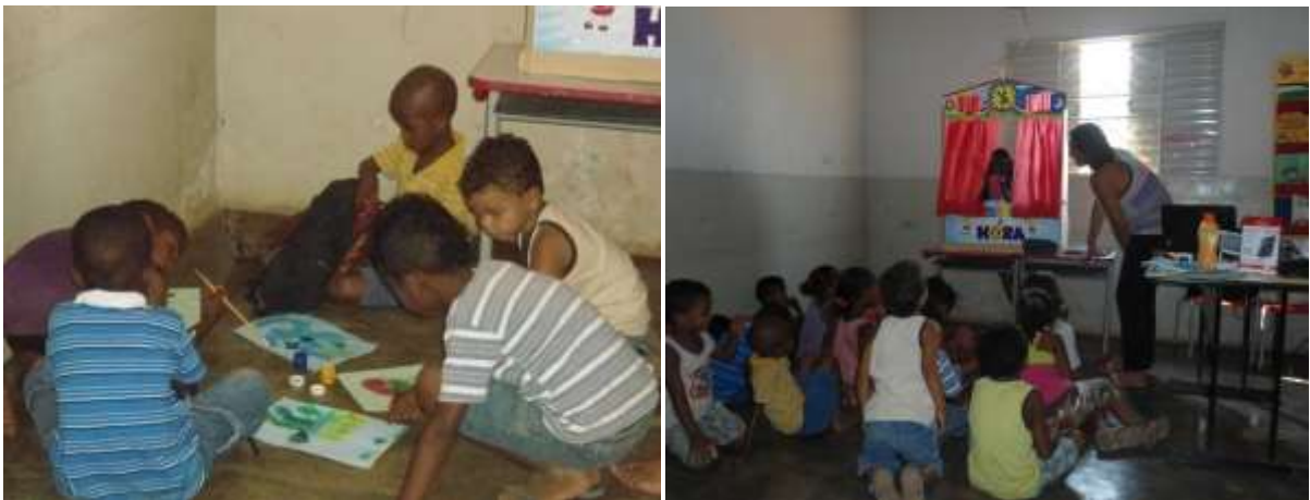
Figura 2 – Crianças pintando, desenhando e contação de histórias com fantoches em escolas rurais, no ano de 2013.

Através do uso do Teatro de Fantoques desenvolveu-se atividades que trabalhassem com a criança associando à coordenação motora, a criação de desenhos através de sua imaginação e desejos. Por ser um boneco capaz de motivar as crianças, o fantoche também permite que elas contem histórias ligadas à sua realidade, e, dessa maneira, pode-se também aprender com cada uma dessas crianças (Figura 1).