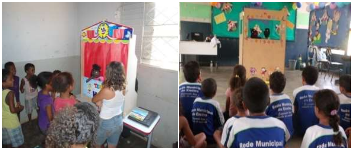
Figura 3 - Apresentação de Teatro de Fantoches nas escolas pesquisadas, no ano de 2013.

Ressalta-se que as crianças que tiveram contato com o boneco, ou seja, com o Teatro de Fantoche, aprenderam a respeitar as diferenças entre elas, e principalmente a combater o preconceito (Figura2). Por ser um boneco que causa alegria e curiosidade fez com elas melhorassem seu desenvolvimento em sala de aula. Começaram a participar mais dos momentos de leitura e compreenderam a importância de estudar e de buscar novos conhecimentos.