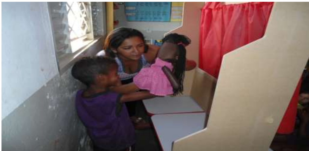
Figura 1- Oficina de manipulação com alunos da Escola Jacubinha I, no ano de 2013.

As oficinas eram aplicadas uma vez por semana, e, enquanto os professores recebiam a capacitação em torno do uso do computador, os alunos do 6º ao 9º anos participavam de atividades em torno do teatro e da dança com os integrantes do projeto. Os alunos da 1ª fase (3º ao 5º anos) participavam da oficina com a utilização do Teatro de Fantoques como observamos na figura 1.