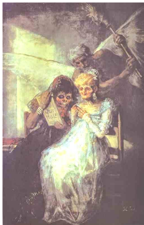
GOYA, Francisco. O tempo, as Velhas . Óleo sobre tela, 181 x 125cm, Museu de Belas Artes, Lille, 1808 – 1812.

Disponível em: emersoncardosoemrson.blogspot.com/2014/10/2.html . Acesso em: 24 jun. 2018.